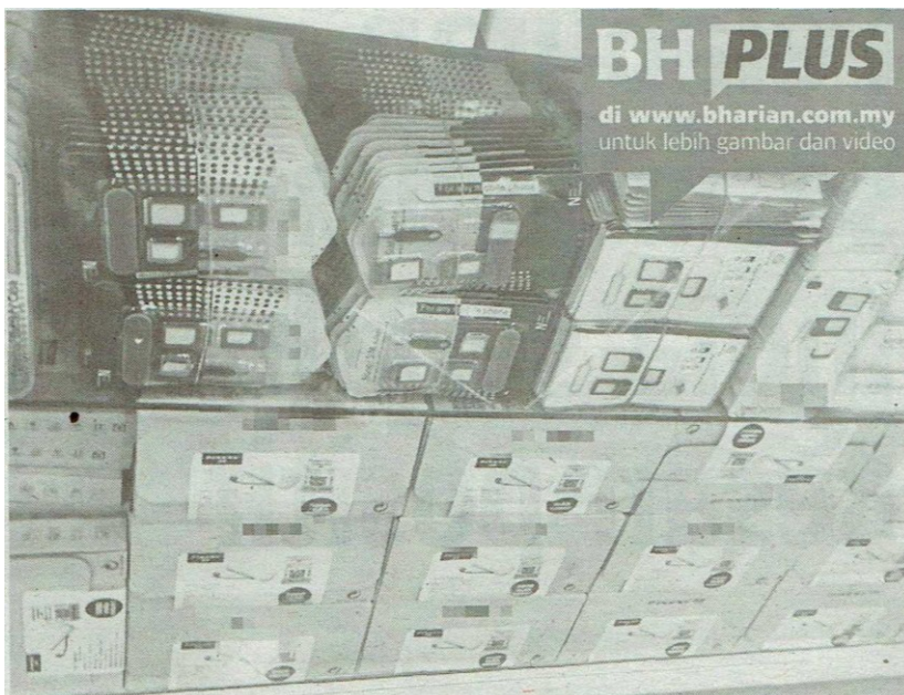
Lambakan barangan elektrik tiruan dan tidak berkualiti yang berada di pasaran.