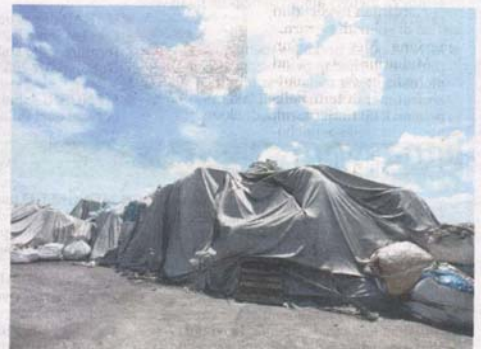
SEBANYAK 51 kilang plastik haram dikesan masih beroperasi di seluruh Selangor. - Gambar hiasan

Mengulas lanjut, Sze Han berkata, tiga notis juga telah dikeluarkan terhadap pemilik tanah yang didapati menyalahgunakan tanah mereka dengan membenarkan kilang plastik haram untuk beroperasi. - Bernama