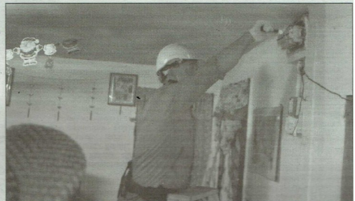
SEORANG anggota SESB memeriksa sambungan bekalan elektrik dalam operasi itu.